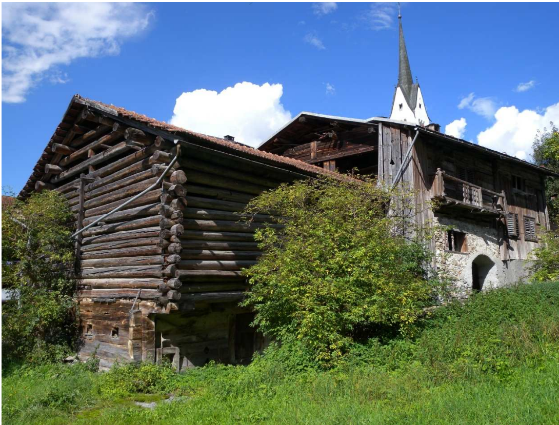
Die Restaurierung des sich im Besitze des Vereins befindende Jooshuus wird dieses

Ebenfalls liegt der Schadenkatalog vor. Die Arbeitsgruppe Jooshuus ist dabei Sanierungsmassnahmen zu erarbeiten welche dann in Etappen umgesetzt werden können.